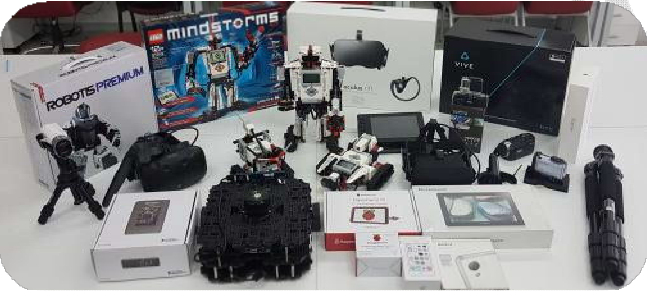
Gömülü Sistemler Laboratuvarı Çalışma Ekipmanları.

Eğitim sistemimiz sanayi ve özel sektörle iç içe olup, lisans programındaki öğrencilere ileri teknolojilerde kullanılacak yazılım ve donanımların tasarımı, gerçekleştirilmesi ve uygulama alanları için gerekli bilimsel beceriler kazandırılmaktadır. Ayrıca öğrencilerimize özel sektördeki çalışma şartlarına uyum sağlamaları amacıyla son sınıfta bir yarıyıl boyunca tercih ettikleri bir sektörde çalışma olanağı sunulmaktadır.