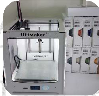
Ultimaker 3D Yazıcı.