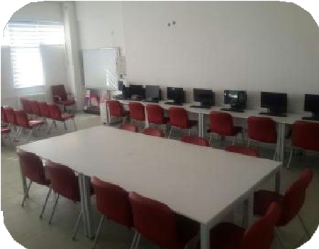
Görüntü İşleme Laboratuvarı.